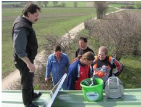
Wie am Bau: 5 Personen vor Ort, einer arbeitet, die anderen schauen entspannt zu.

Bitte um das gleiche zahlreiche Kommen beim nächsten Arbeitseinsatz im Herbst. Termin siehe unten!!