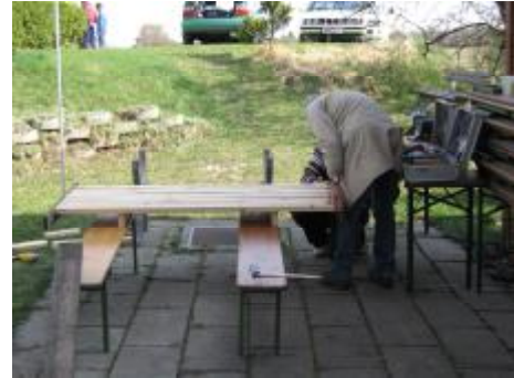
Rechts wird soeben der neue Tisch zusammengeschraubt